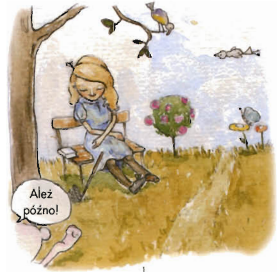
Alicja zmęczona zabawą zasnęła w ogrodzie. Obudził ją przebiegający w pośpiechu Królik.