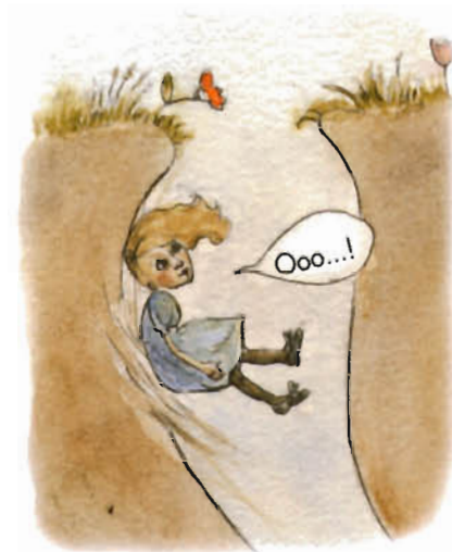
Dziewczynka bez zastanowienia wskoczyła za nim do jamy.